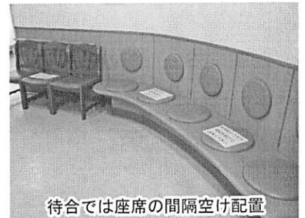
待合では座席の間隔空け配置