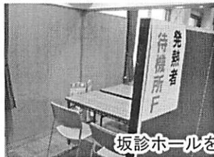
坂診ホールを利用した隔離スペース

新型コロナウイルス関連などで健康や生活でのお困りごとがあれば、診療所にご相談ください。（平日13時～16時でのご連絡をお願いいたします。）